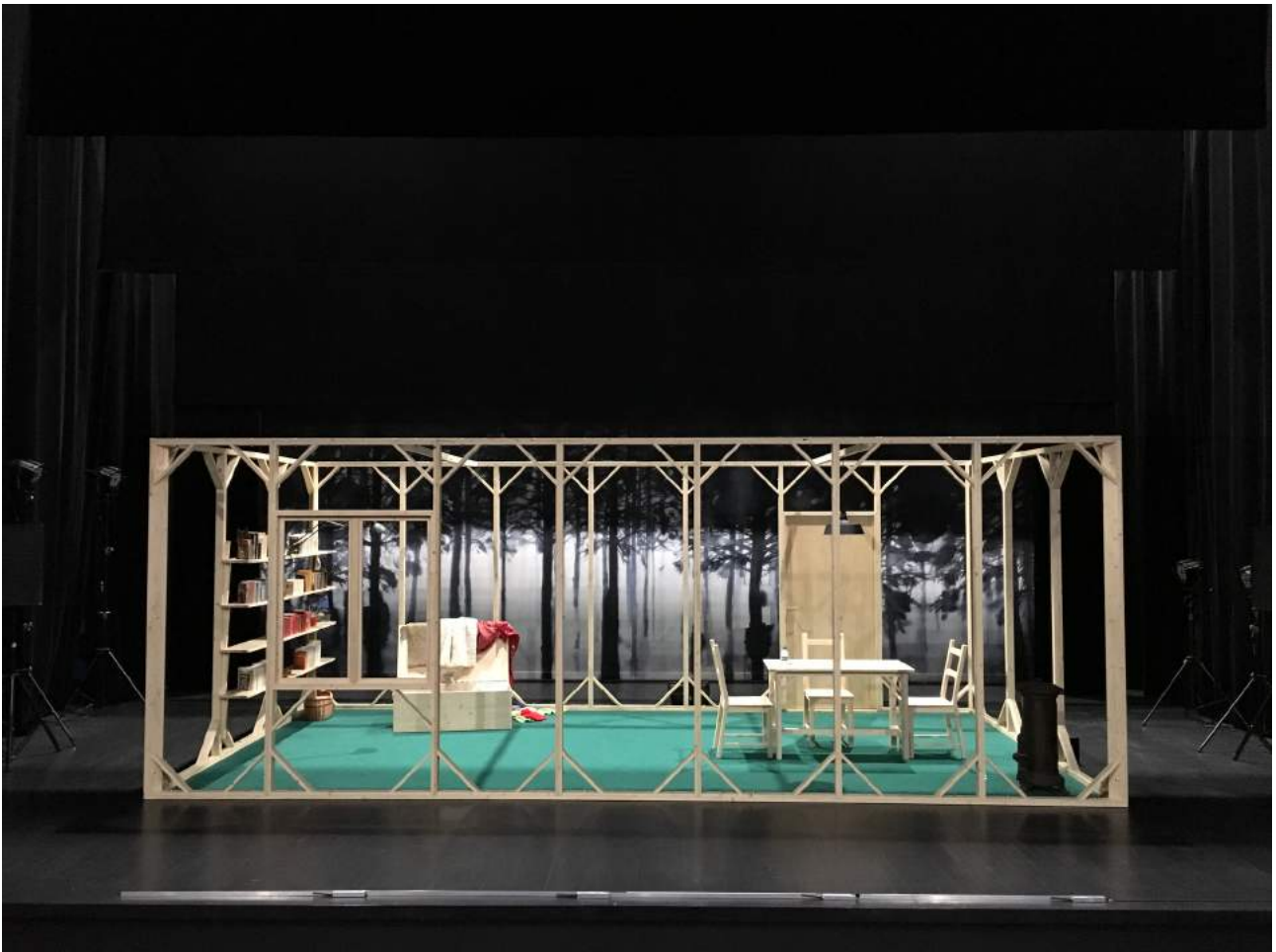
Version 7 mètres